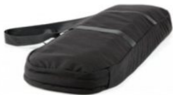
ソフト収納ケース